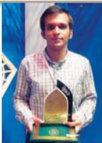
حضور داشتند کارشناس فرهنگی دانشگاه در

این باره گفت: این جشنواره که با هدف تحکیم وحدت و انجام دانشجویان سراسر کشور برپا شده بود، شاهد حضور ۱۲ قاری بین المللی، گروه توشیح القدير و مقامات بلند پایه فرهنگی وزارت علوم بود وی اضافه کرد: در این جشنواره ۴۰۰ مهمان، ۳۶۱ دانشجو در دو بخش برادران و خواهران حضور داشتند. شرکت کنندگان این جشنواره ۳۲۵ اثر شطاهی، ۸۸ اثر پژوهشی، ۸۱ اثر ادبی، ۱۴۴ اثر هنری و ۳۷ اثر در بخش فناوری به دبیرخانه این جشنواره ارسال کرده بودند.